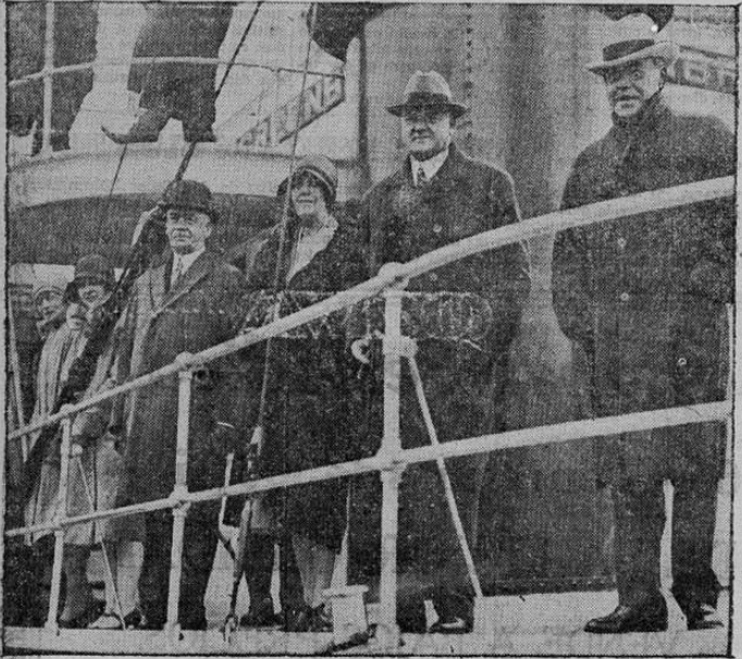
El viaje del presidente Hoover por el río Ohio se caracterizó por el mal tiempo. El presidente, a quien vemos aquí en la cubierta del barco Greenbriar, en que hizo el viaje, se lamenta de que no pudo dedicarse ni un momento a su deporte favorito: la pesca.