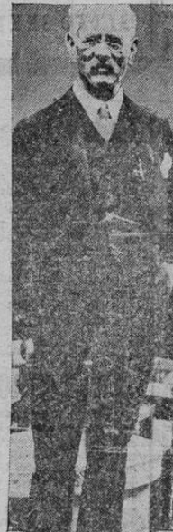
El profesor Otto Jespersen, notable filólogo danés, ha “confeccionado” un nuevo lenguaje universal, que espera tenga mas aceptación y mejor suerte que