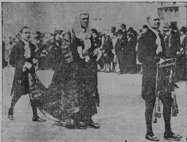
LA foto muestra al lord canciller, Lord Sankey, encabezando el desfile de los jueces de Londres para la apertura del Parlamento. Ló 1 Sankey, viste el traje que la tradición ordena